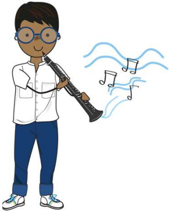
tocar un instrumento