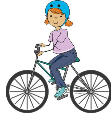
montar en bicicleta